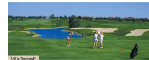
Golf de Disneyland®