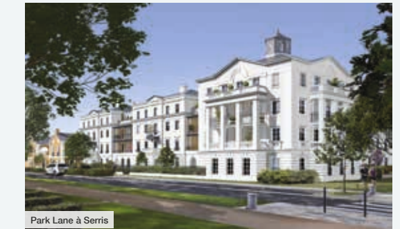
Park Lane à Serris

RCS : 814628939. Illustrations d'ambiance, non contractuelles destinées à exprimer une intention architecturale d'ensemble et susceptibles d'adaptation : Gilles Coulon et ValentinStudio. Conception: OSWALD ORB - 10/2019. NE PAS JETER SUR LA VOIE PUBLIQUE.