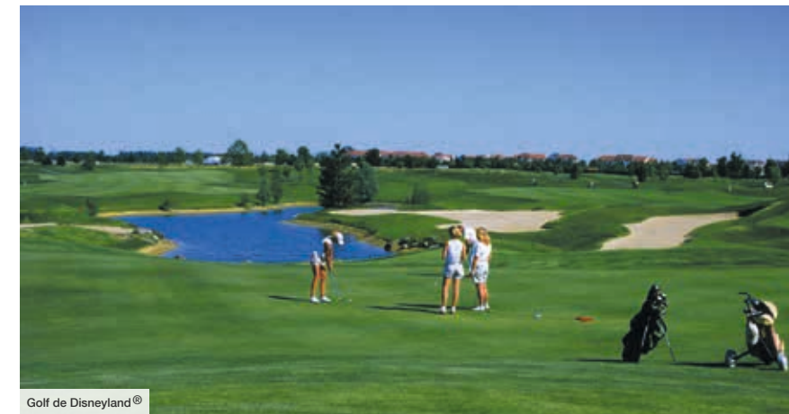
Golf de Disneyland®