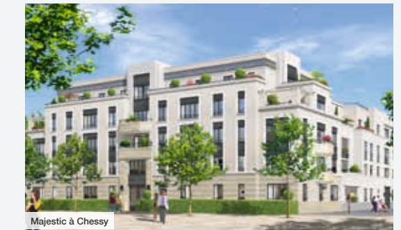
Majestic à Chessy

Forts de notre expertise, nous garantissons la qualité et la pérennité de nos réalisations en faisant appel aux meilleurs architectes, bureaux d'études les plus pointus et paysagistes de renom.