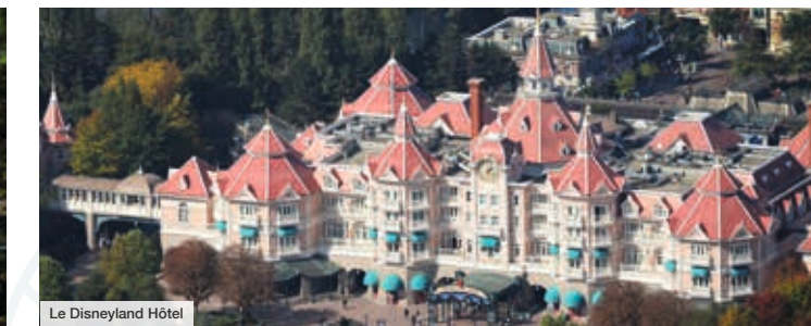
Le Disneyland Hôtel