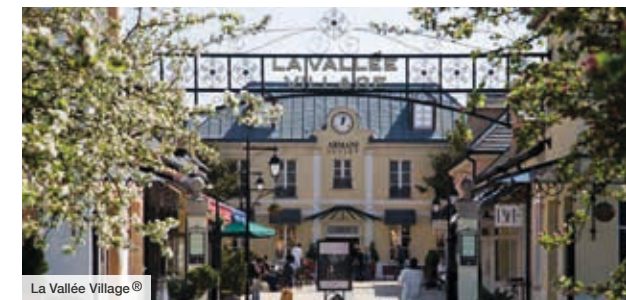
La Vallée Village®