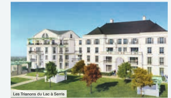
Les Trianons du Lac à Serris