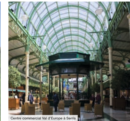
Centre commercial Val d'Europe à Serris